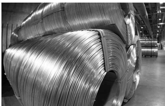
Alumínium tekercs, Fjaraaal, Izland