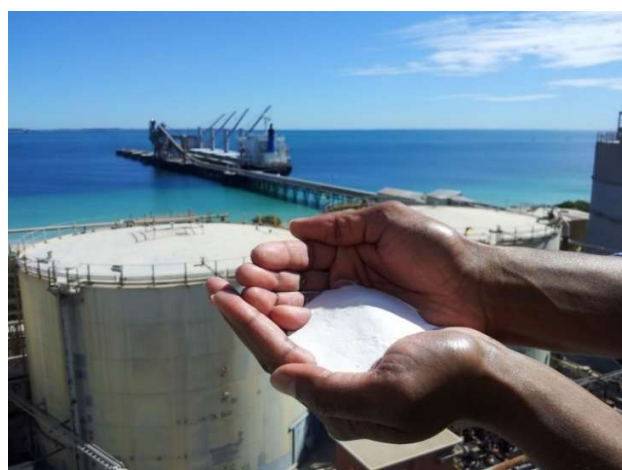
Bright Alumina, Kwinana Ausztrália

Az Alcoa Beszállítói normákra vonatkozó általános kérdéseit írja meg a SupplierSustainability@alcoa.com e-mail címre .