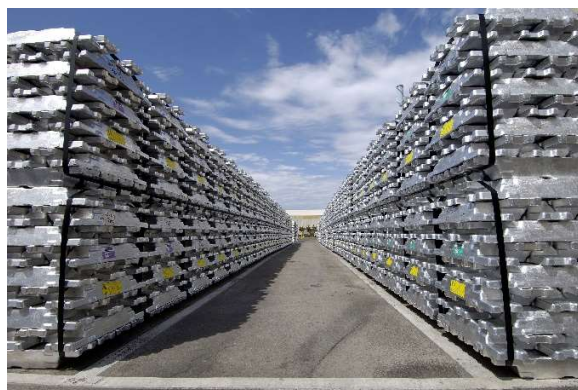
Aluminiümöntvények, Portland, Ausztrália