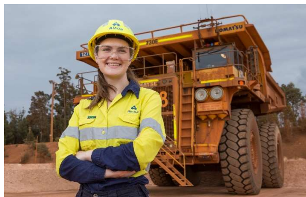
Végzős diákok, Willowdale, Ausztrália